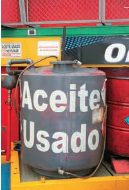
Disposición adecuada del aceite usado en un centro automotriz.

En ese sentido, el Presidente de la ACP destaca el papel de este nuevo actor, que “con la nueva nor-